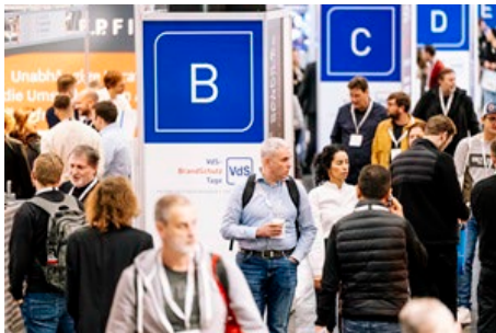
Die große internationale Fachmesse auf den VdS-BrandSchutzTagen