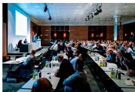
Insgesamt sechs Fachtagungen finden parallel zur Fachmesse statt