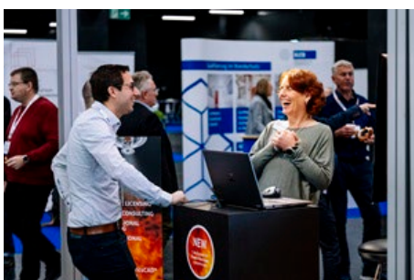
Die VdS-BrandSchutzTage bieten optimale Gelegenheiten zum Netzwerken