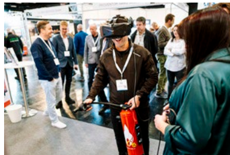
Die Besucher:innen der Messe informieren sich über Brancheninnovationen