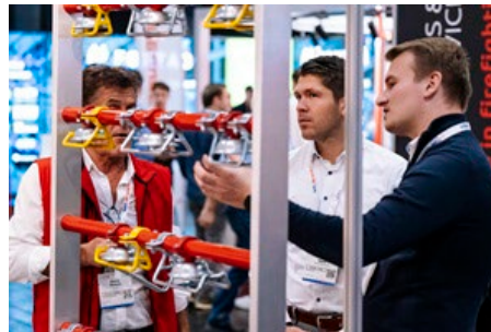
Auf den VdS-BrandSchutzTagen 2025 sind rund 180 Aussteller vertreten