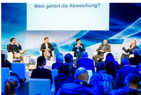
Für alle Messebesuchende kostenlos: VdS-BrandSchutzTalk und Fachforen