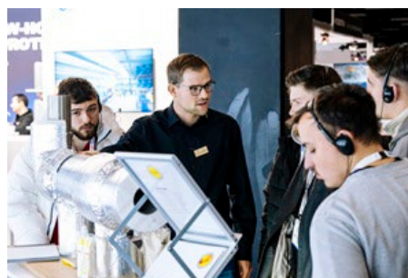
An beiden Tagen führen Messerundgänge zu interessanten Exponaten